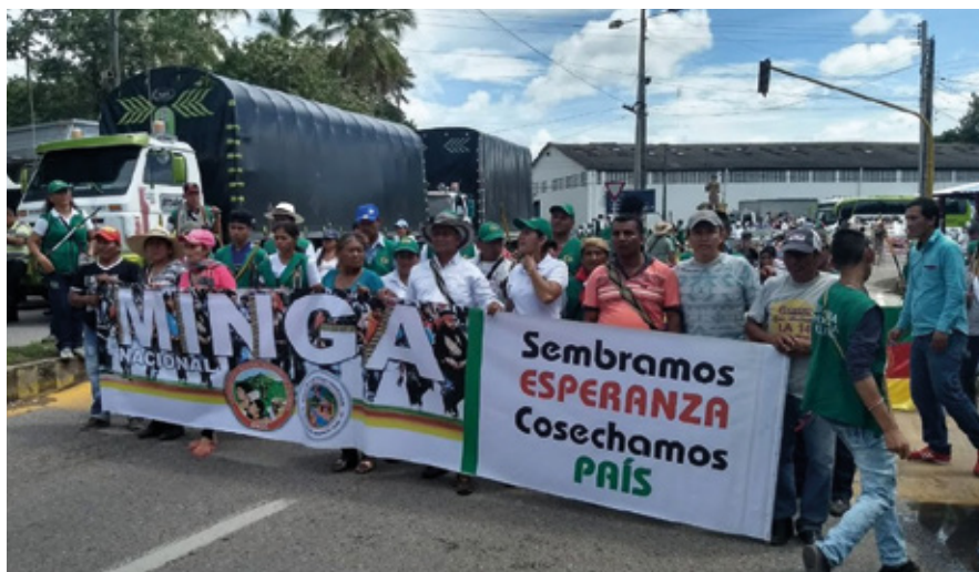
Las mingas han fortalecido el movimiento indígena

Las movilizaciones y el fortalecimiento de las organizaciones indígenas de los años 70 con los Consejos Regionales Indígenas en los departamentos con mayor población aborigen, especialmente en el Cauca derivaron la década siguiente en la creación de la ONIC, Organización Nacional Indígena de Colombia. Paralelamente surge en 1984 el Movimiento Armado Quintín Lame-MAQL, guerrilla nacida de las entrañas de la comunidad Nasa con fuerte sentido identitario y de defensa propia que protegía las comunidades de las arremetidas de los paramilitares y la fuerza pública. Con la desmovilización del M-19 y la mayor parte del Ejército de Liberación Nacional-EPL-en 1989 se abrió la puerta para la convocatoria de la Asamblea Nacional Constituyente (ANC) que proclamó la Constitución de 1991, Carta Política que reconoció por primera vez y de forma cualitativa los derechos de las comunidades étnicas. En esa asamblea participaron dos constituyentes indígenas y uno del desmovilizado grupo Quintín Lame, que