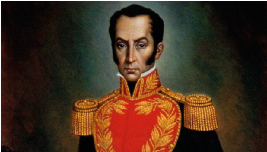
Libertador Simón Bolívar

Para que no sea realidad el amargo sentimiento del Libertador de haber predicado en el desierto y arado en el mar, la historia y el futuro nos exigen lograr la paz y consolidar no solamente la unión entre los colombianos sino también construir una verdadera integración Latinoamericana y del Caribe, para que la región cuente en los destinos del mundo.