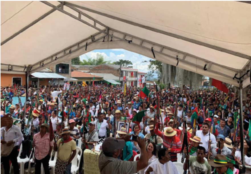
El que manda manda obedeciendo

Así mismo, se ha podido evidenciar falta de capacidades o experiencias, de las y los líderes indígenas elegidos para proponer proyectos de Ley o iniciativas legislativas que favorezcan los principios vitales de las luchas de los pueblos indígenas en general.