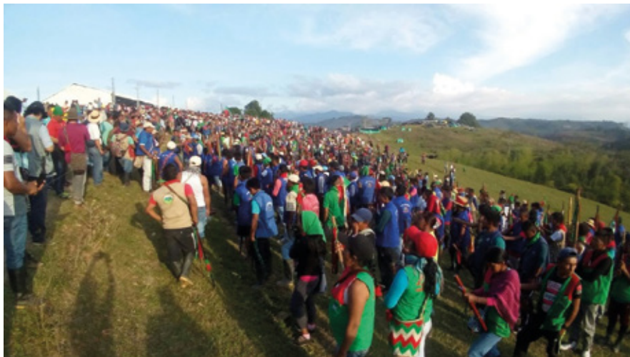
El territorio se defiende porque es la madre tierra