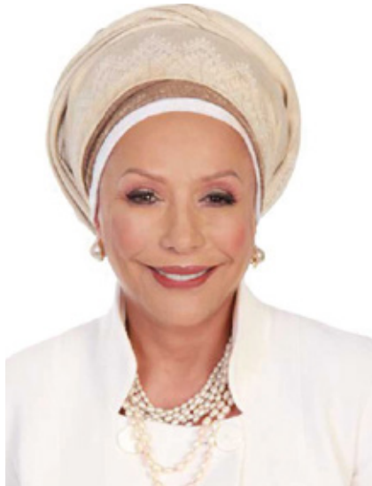
Piedad Córdoba, excandidata presidencial de Colombia, senadora de Colombia, abogada defensora de Derechos Humanos

Aún en Colombia el patriarcado y el racismo se imponen para reprimir, segregar y destruir.