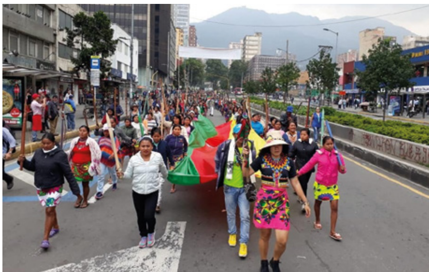
Las movilizaciones indígenas hacen avanzar sus derechos

El reto institucional y social parte de la comprensión de la dimensión de los derechos a la identidad, la cultura, la autonomía, la autodeterminación y el respeto a su cosmovisión. Una democracia pluricultural debe armonizarse con el acercamiento holístico al concepto de territorio, así como al impacto diferenciado que ha tenido la violencia sobre ellos como mecanismo de exterminio, y hoy ante el ataque a la naturaleza que instala un riesgo colectivo a las entrañas de una forma de existencia y vida comunitaria que tiene profundo arraigo y conexión con la madre tierra.