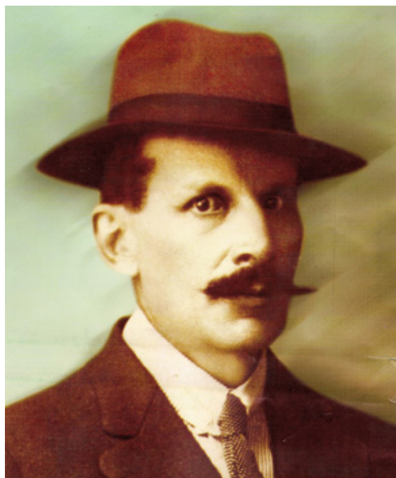
Rafael Uribe Uribe (12 de abril de 1859 - 15 de octubre de 1914)