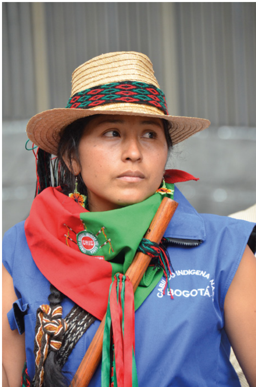
Mujer indígena CRIC