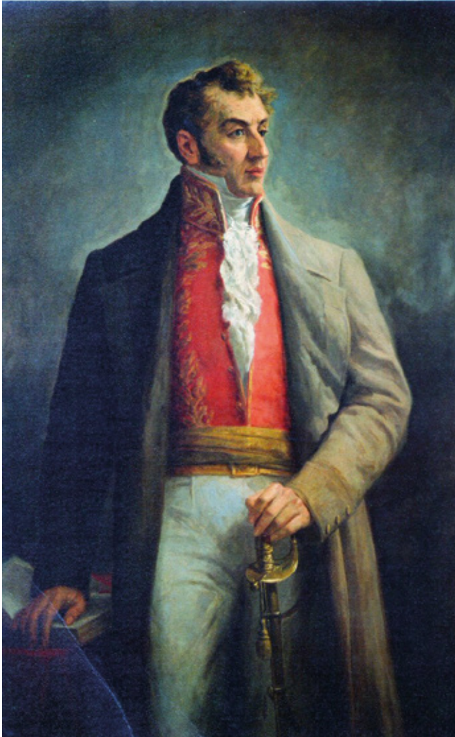
Pintura retrato de Antonio Nariño en acuarela por Ricardo Acevedo Bernal

Sin embargo, había una generación nueva, absolutamente decidida a expulsar a la Corona de América. Y esta decisión es el verdadero punto de quiebre de nuestra convulsionada historia.