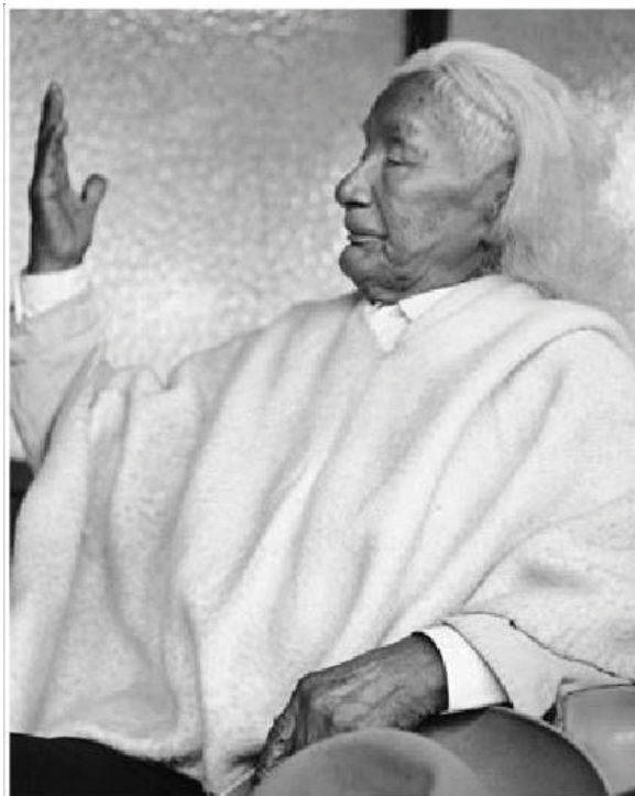
Manuel Quintín Lame

chos años después como elemento central para la movilización, al grado que su nombre fue tomado por el grupo de autodefensa Nasa, convertido en grupo guerrillero en 1984, paradójicamente en momentos en que las guerrillas más importantes de la época, FARC, M-19, ELN y EPL, adelantaban negociaciones de paz con el gobierno del presidente Belisario Betancur a través de la coordinadora guerrillera que los integró temporalmente.