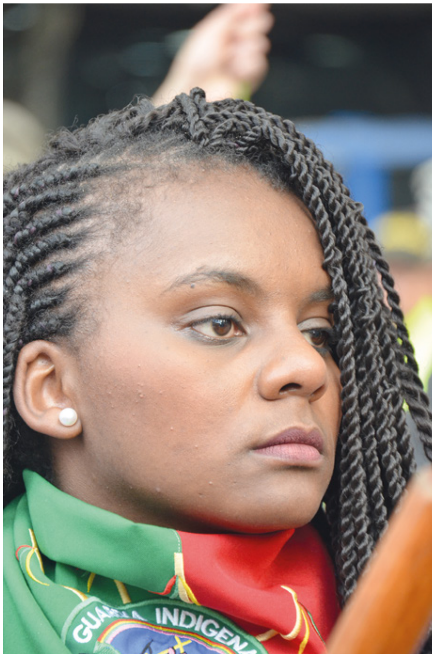
Mujer de la Guardia Indígena