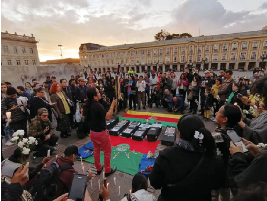
Los asesinatos no doblegan la resistencia ni la memoria

De otro lado, no propongo una biopolítica en el sentido del geógrafo y politólogo sueco, Rudolf Kjellén, quien pensó el Estado como un organismo, aplicando este concepto a la vida social, a las luchas de ideas e intereses entre grupos y clases que transcurren en la sociedad[1].