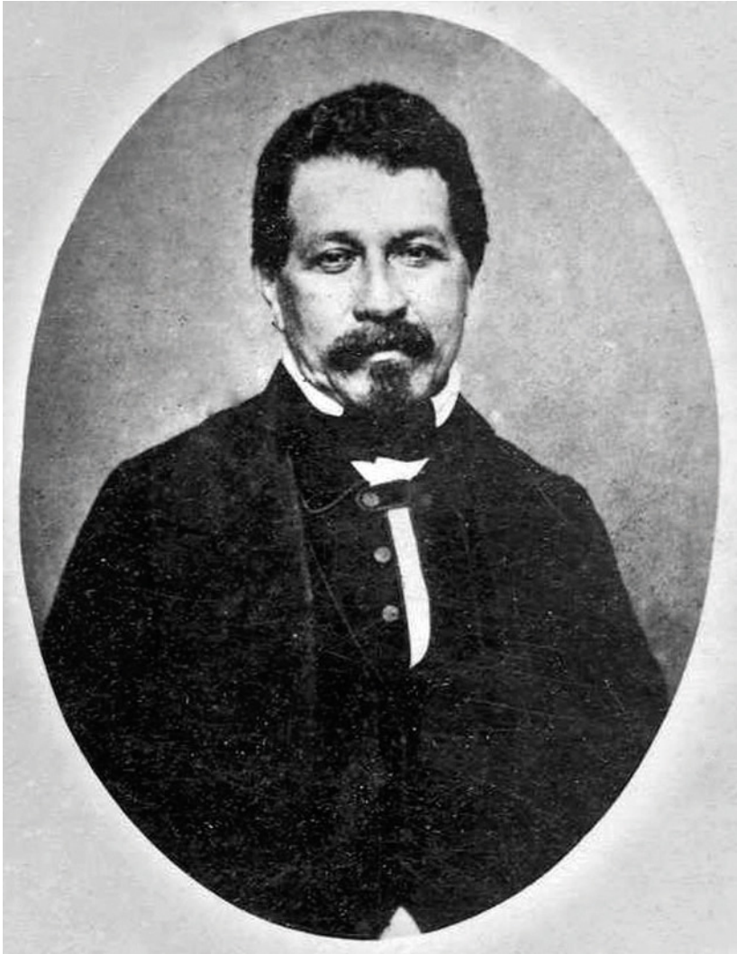
Juan José Nieto, a la fecha, único Presidente afrodescendiente de Colombia