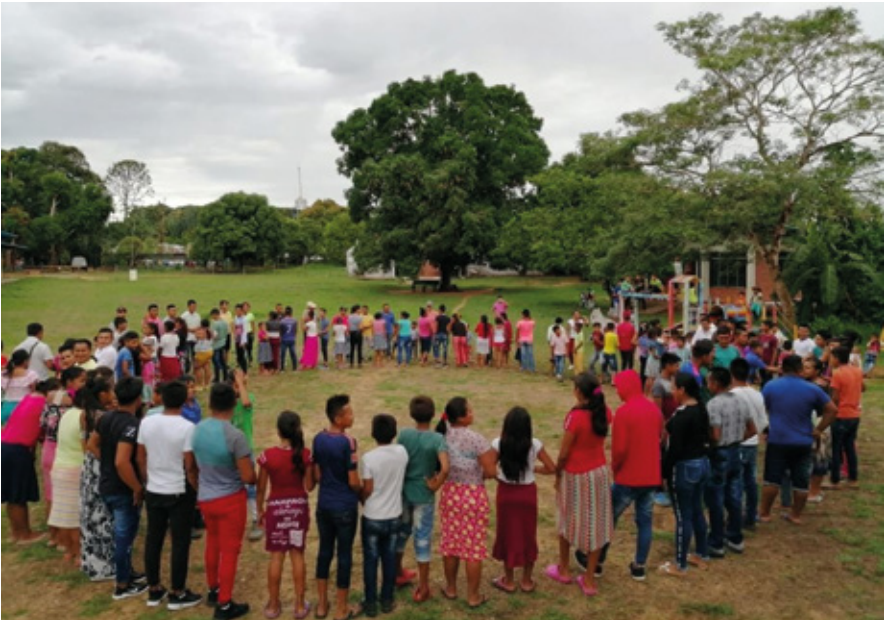
Indígenas reunidos en diálogo comunitario.

En esta medida los derechos de los pueblos indígenas y los derechos de las comunidades afrodescendientes deben ser reconocidos como derechos colectivos y que realmente cuenten con garantías plenas e integrales de ejecución e implementación en la estructura democrática del estado colombiano y estados latinoamericanos.