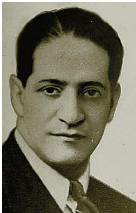
Jorge Eliecer Gaitán. Líder político y abogado asesinado el 9 de abril de 1948

“Y ver cómo esos militares actuaban. Pensad en que aquel pueblo había sido horriblemente segado por las ametralladoras; que mil hogares se hallaban enlutados, que todo era dolor, que todo era sangre. Pensad que aquel pueblo se debatía inútilmente en los rigores del hambre, ya que no podía trabajar. Pensad que las esposas tenían que atender al sustento de sus pequeños hijos porque los padres huían en la montaña atemorizados por el plomo cobarde y homicida: pensad que todo era desolación, todo era luto, todo era sombra, todo era un río de sangre, revuelto con un río de lágrimas sobre el cual navegaba deshecha y perdida la quilla del dolor humano. Pues bien, señores: ante tal tragedia, los militares indignos del nombre, indignos de las armas de la República, se entregaban a la orgía de proporciones caligulescas. En las casas de la United Fruit —siempre la United Fruit— desarrollaban orgías de oprobio y de vergüenza”.