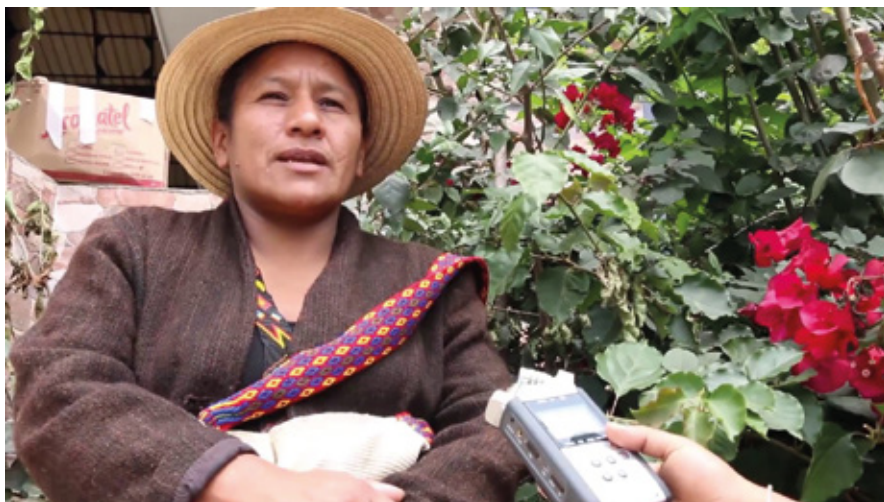
Aida Quilcue. Líder del Consejo Regional Indígena del Cauca. Senadora de la República 2022-2024

Como reconocimiento a toda una vida de lucha por la causa indígena y popular fue electa al Senado de la República el 13 de marzo de 2022 para el periodo 2022-2026.