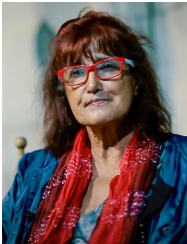
Patricia Ariza. Ministra de Cultura periodo 2022-2026. Dramaturga, actriz