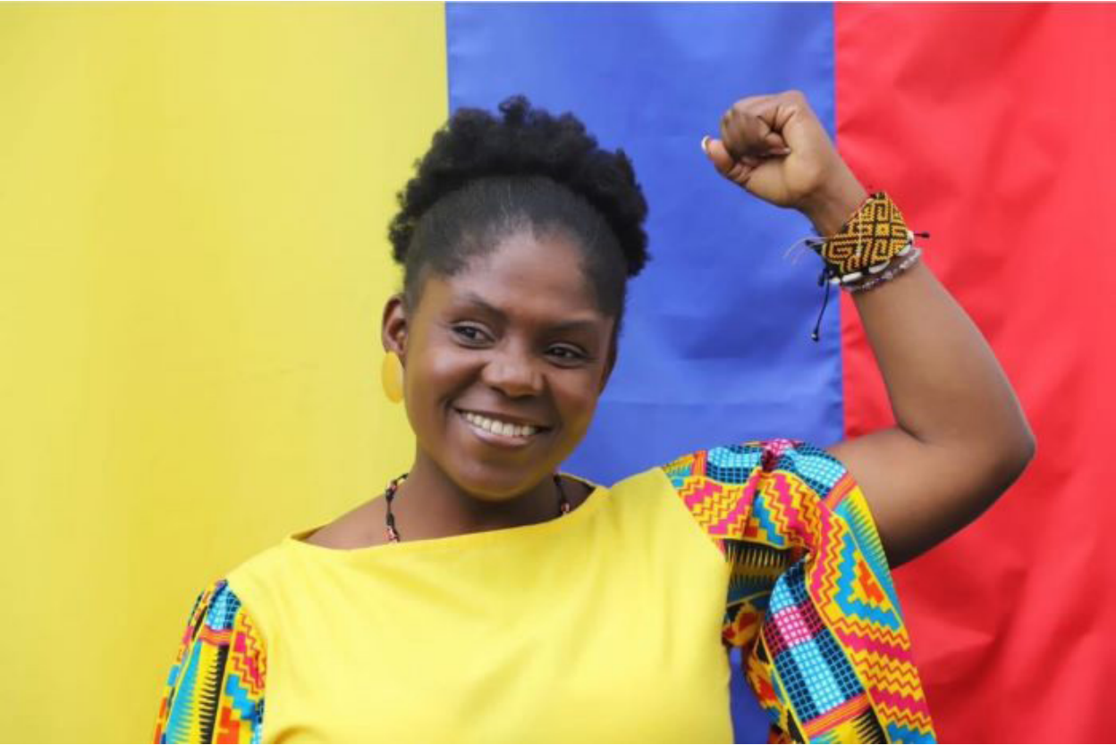
Francía Elena Márquez Mina. Primera mujer afrodescendiente elegida vicepresidenta de Colombia, periodo 2022-2026

dades étnicas no solo ha sido compleja para los indígenas, también la presencia de mujeres afrodescendientes al interior de la circunscripción especial es minoritaria.